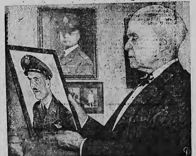
GEN. BENJAMIN OLIVER DAVIS, SR. (retired) is shown at his home in Washington, D.C., looking at a photo of his son, Col. Benjamin Oliver Davis, Jr., 41, who was promoted to the temporary rank of brigadier general in the Air Force. Young Davis is the first Negro to attain the rank of general in the Air Force. His father was the first member of his race to become an Army general. Davis Jr. is now serving as director of operations and training of the Far East Air Forces.